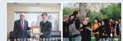
校长会见国外教育界领导